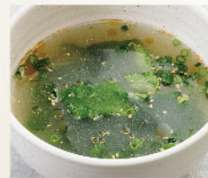
ワカメスープ Seaweed soup ¥580 (税込¥638)