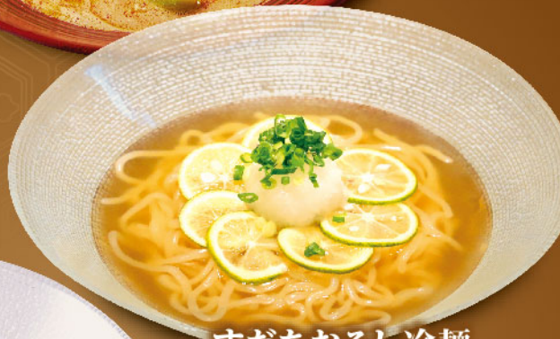
すだちおろし冷麺 Sudachi Cold Noodles ¥1,380 (税込¥1,518)