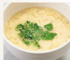
玉子スープ Egg Soup ¥580 (税込¥638)