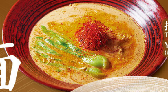
担々麺 Tantan Ramen ¥980 (税込¥1,078)