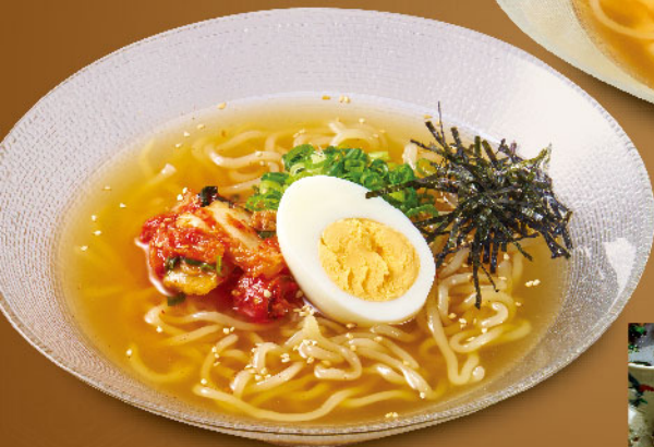
冷麺 Cold Noodle ¥1,380 (税込¥1,518) ハーフHalf ¥880 (税込¥968)