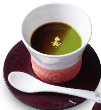
自家製抹茶プリン Homemade Matcha Pudding ¥490 (税込¥539)