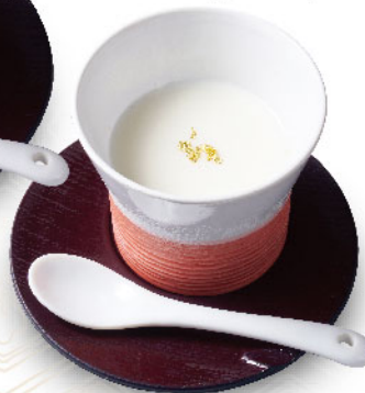
自家製なめらか 杏仁豆腐 Homemade Almond-Favored Sweet Tofu ¥490 (税込¥539)