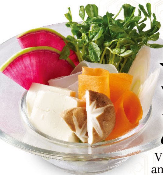
Vegetables and seafood