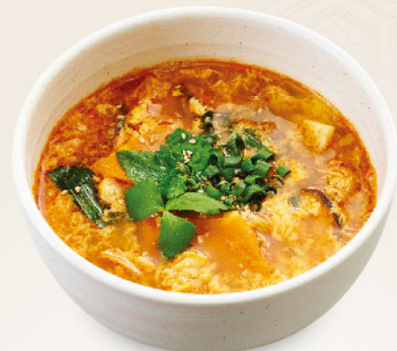
極カルビスープ ¥980 (税込¥1,078) Kalbi soup