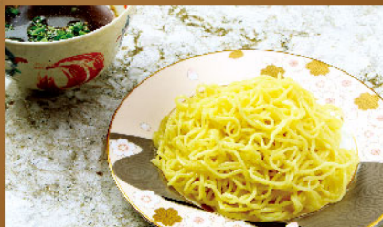
昆布水つけ麺 Kombu water tsukemen ¥1,180 (税込¥1,298)